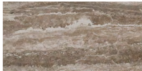
GRIS Abujardado / Bush-hammered